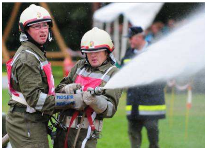
Nasslöschbewerb in St. Oswald