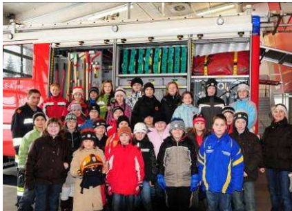
Volks- und Hauptschule zu Besuch