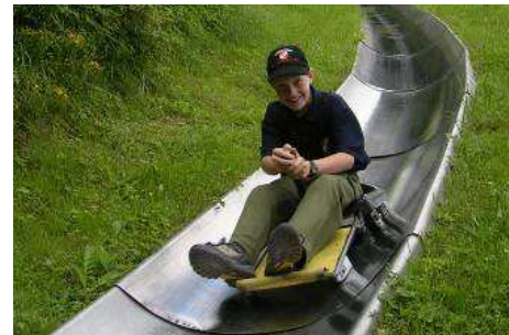
Jugendgruppe beim Sommerrodeln