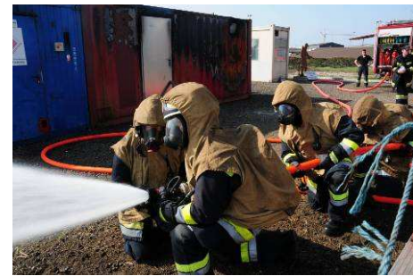
Atemschutzübung am Voest-Gelände