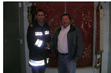
Internationaler Besuch aus Kanada