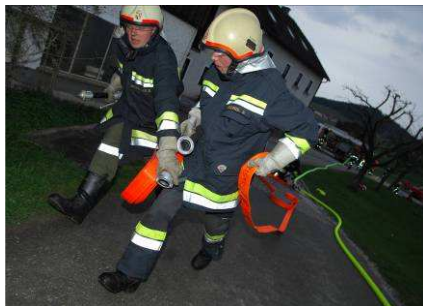
Brandübung Ortner – Wartberg