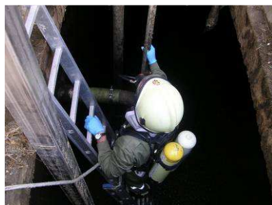
Atemschutzeinsatz in Jauchegrube