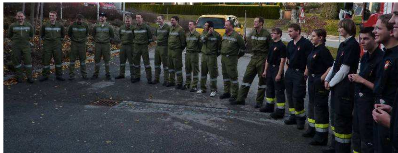
technische Hilfeleistungsprüfung in Bronze der Feuerwehren St. Oswald und Marreith