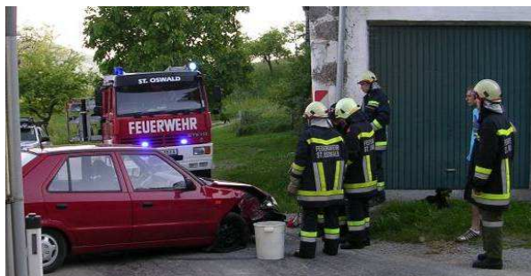
Aufräumarbeiten nach Verkehrsunfall