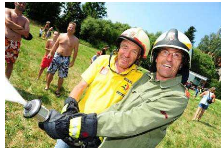
Ferienpassaktion am Integrationslager